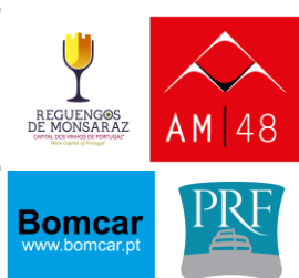
Placa n.º 4 (50x52cms)