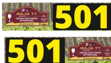
Placas n.º 3 (17x67cms)