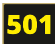
Placa n.º 1 (15x19cms)