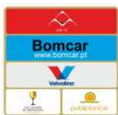
Placa n.º 4 (50x52cms)