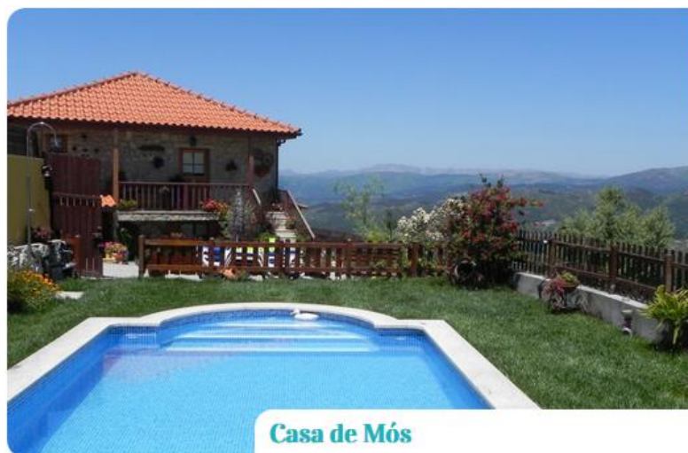
Casa de Mós