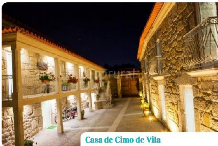
Casa de Cimo de Vila

As casas dispõem de cozinha equipada (com microondas, placa, forno e frigorífico), sala (com sofá cama), televisão led, ar condicionado e internet wireless.