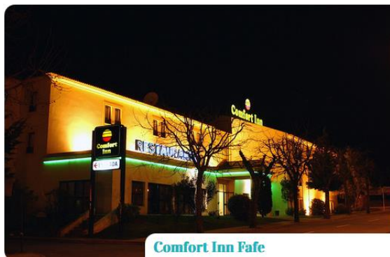
Comfort Inn Fafe

A cidade de Fafe tem disponíveis, entre outros, os seguintes estabelecimentos de hotelaria: