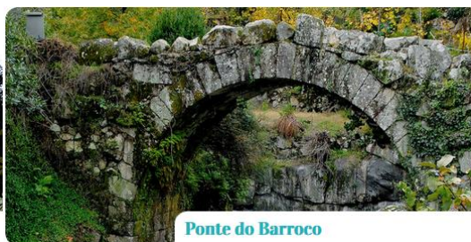
Ponte do Barroco