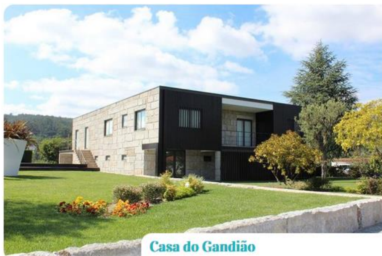
Casa do Gandiã