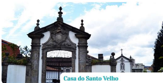
Casa do Santo Velho