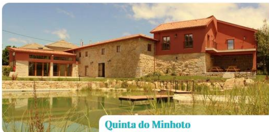
Quinta do Minhoto

Capacidade: 5 quartos duplos (com capacidade para colocar camas extra)