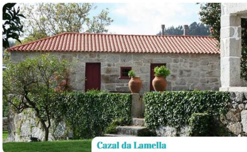
Cazal da Lamella