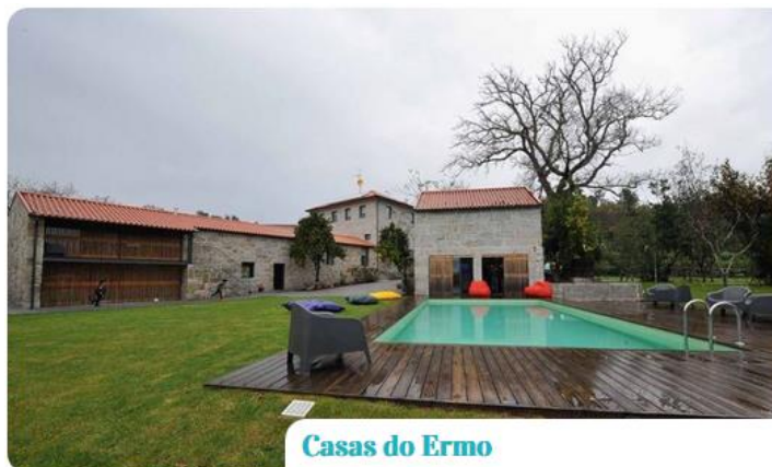
Casas do Ermo

Rua do Ermo, 335 4820-063 Estorãos Fafe N: 41°28'36.4" W: -8°08'57.5" Tlm: 962 449 135 e-mail: turismo@casasdoermo.com