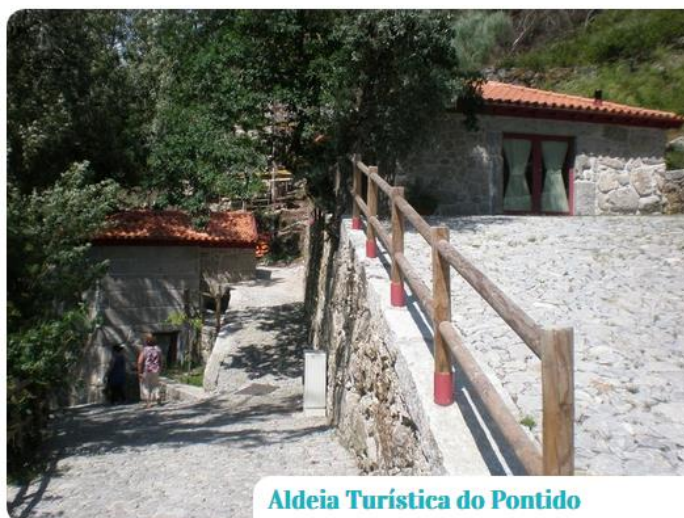
Aldeia Turística do Pontido