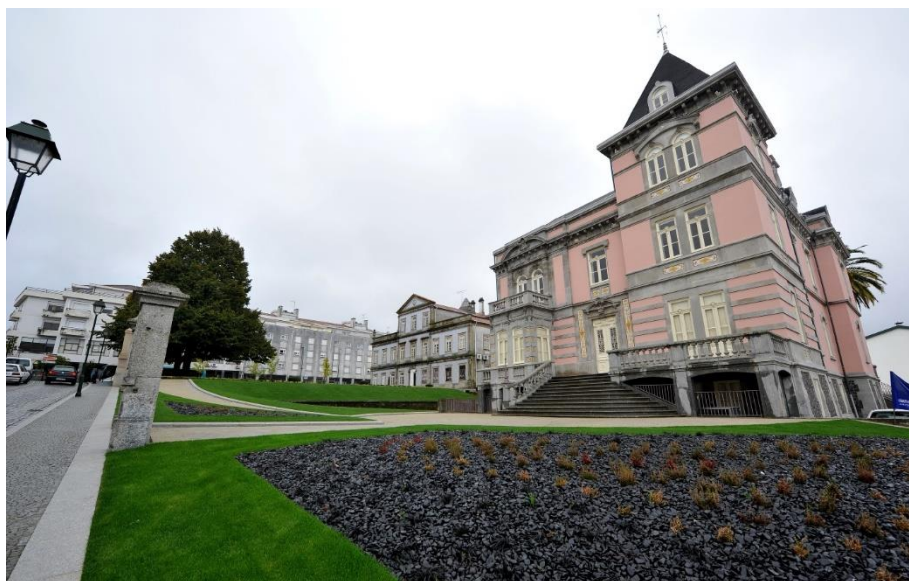
Figura 2 - Secretariado