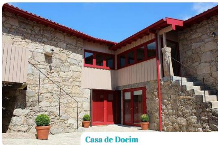
Casa de Docim