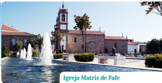
Igreja Matriz de Fafe