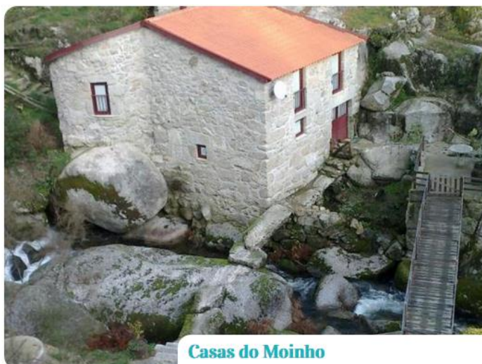
Casas do Moinho