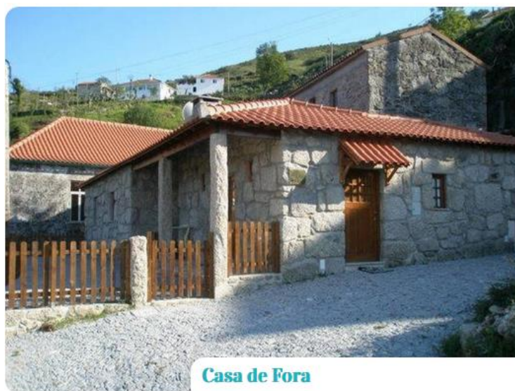
Casa de Fora

14 pessoas (possibilidade de colocação adicional de 2 camas extras e 2 berços)