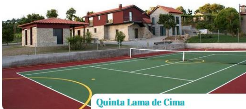
Quinta Lama de Cima