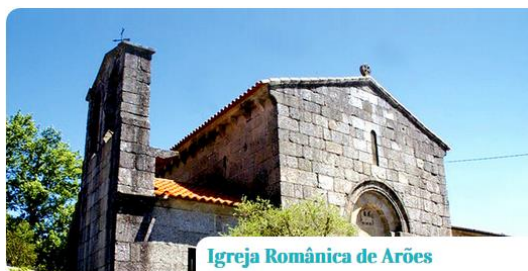
Igreja Românica de Arões