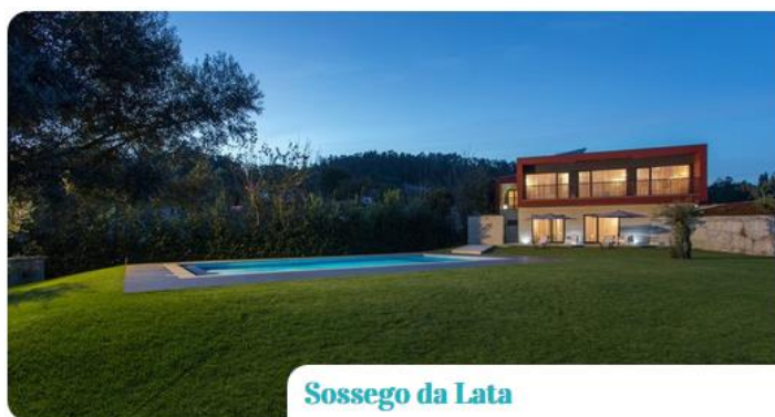
Sossego da Lata

Rua da Lata n.º 186 4820-377 Passos Fafe GPS 41.485112 -8.198586 Telm: 918873636 / 966948954 email: sossegodalata@gmail.com