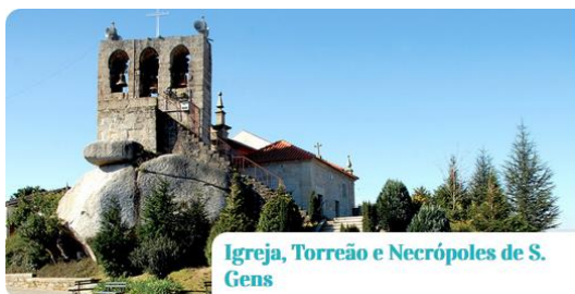
Igreja, Torreão e Necrópoles de S. Gens