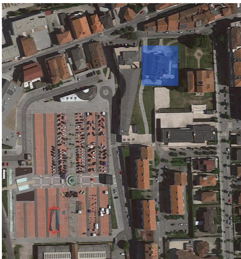
Figura 1 - Localização do secretariado

Casa do Arquivo Municipal Rua Major Miguel Ferreira - Fafe Telemóvel: (351) 917592010