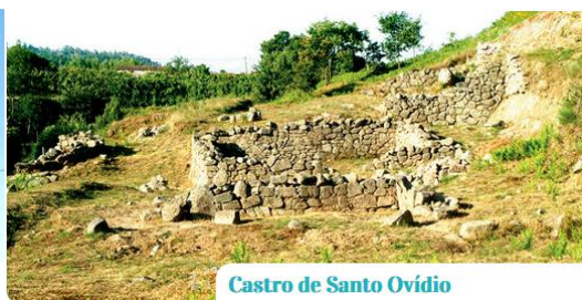
Castro de Santo Ovídio