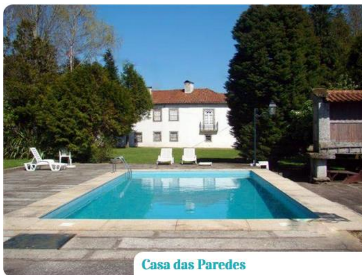
Casa das Paredes

Complexo Turístico de Rilhadas Rua de Canceiro, n.º 444 | 4820-018 Cepães +351 253 591 916 / +351 912 155 568 / +351 935 919 160 41°25'28.42"N / 8°12'53.44"E rilhadas@rilhadas.com www.rilhadas.com | www.facebook.com/Rilhadaturismo Capacidade: 14 quartos duplos