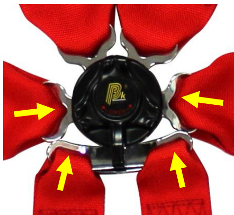
Figura 3 - Locais de colocação de dispositivos elásticos nos cintos de segurança.

A colocação de dispositivos elásticos é proibida nas cintas superiores (ombros). Nas restantes cintas, a sua colocação é apenas permitida nas fivelas metálicas que se encontram na extremidade das mesmas (Figura 3). O dispositivo elástico nunca pode envolver ou deformar a cinta.