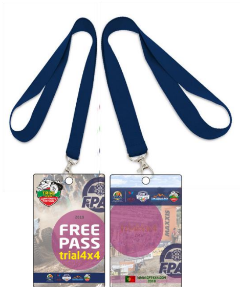
Cartão de PVC - Free Pass entrada nos eventos CPT4x4 2019 com presença da fita de pulso.