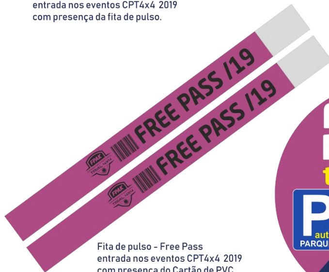
Fita de pulso - Free Pass entrada nos eventos CPT4x4 2019 com presença do Cartão de PVC.