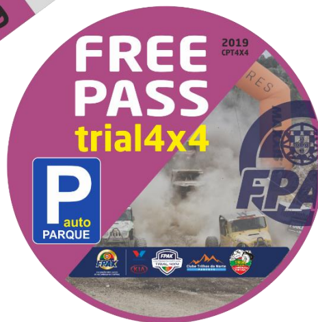
Autocolante Auto - Free Pass entrada nos eventos CPT4x4 2019 com presença do Cartão de PVC e Pulseira .