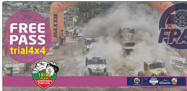
Envelope Kit Free Pass